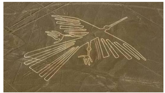
Líneas de Nazca